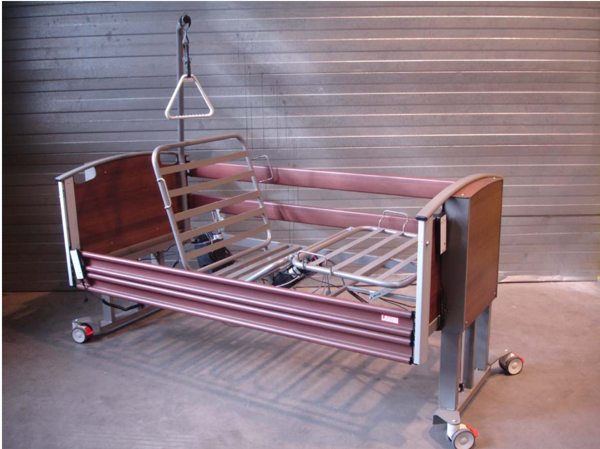
Onderste trap van de H/L verstelling (1 e 350 mm).