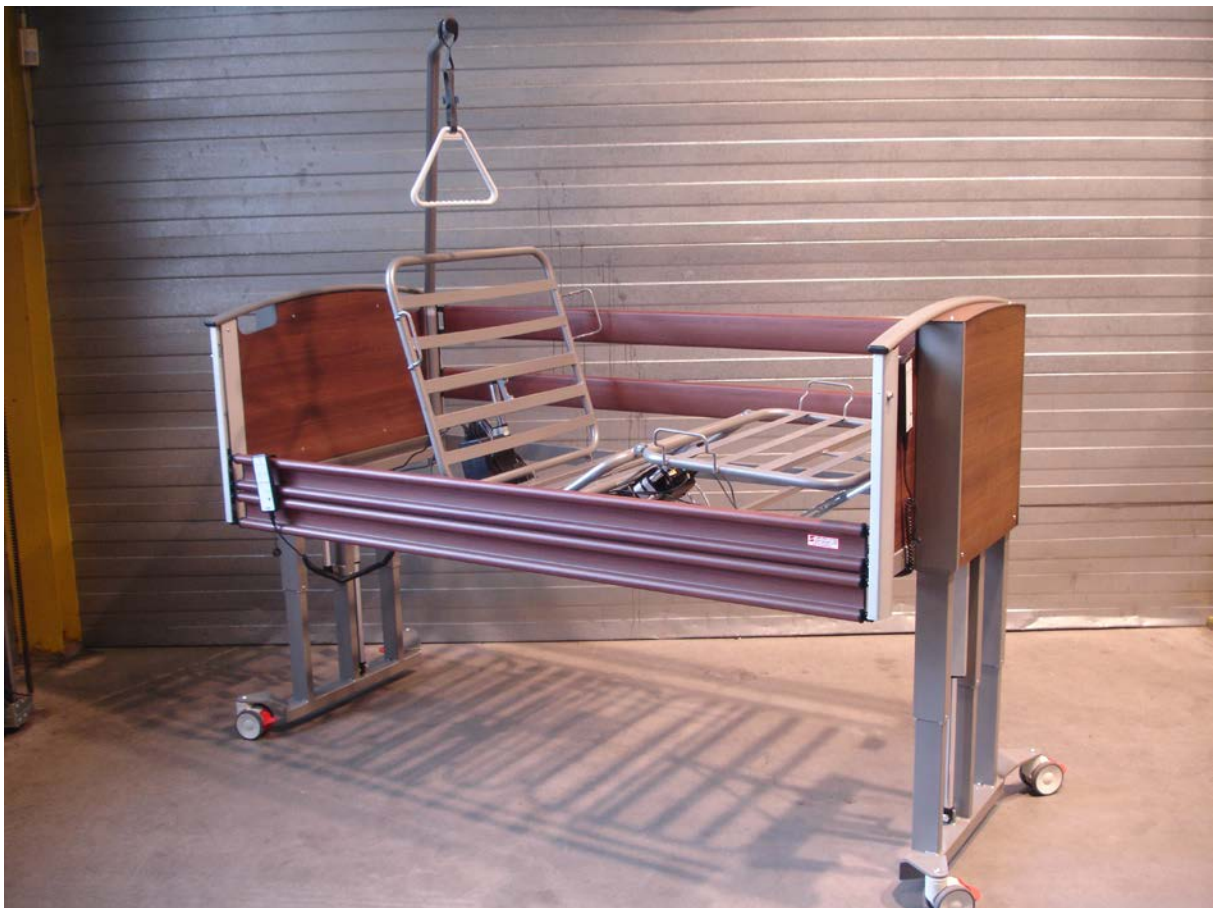
Bovenste trap van de H/L verstelling (2 e 350 mm)