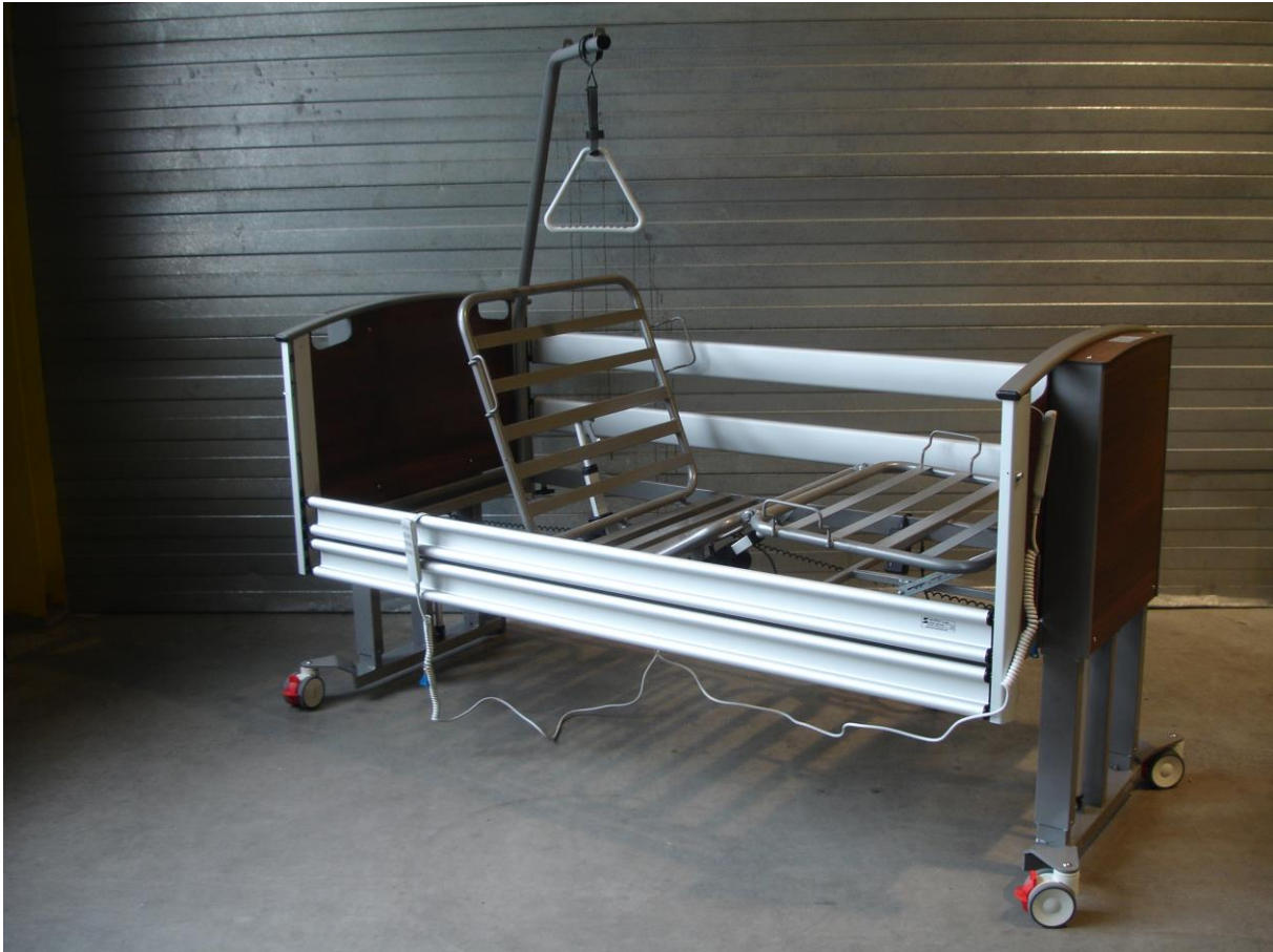
Onderste trap van de H/L verstelling (1 e 400 mm).