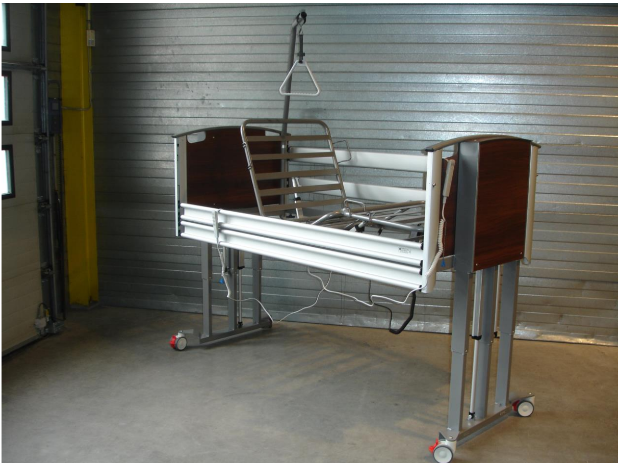
Bovenste trap van de H/L verstelling (2 e 400 mm)